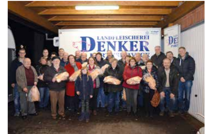
Alle Weihnachtsgänse wurden verteilt