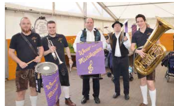
Die Wesermusikanten werden am Samstagmorgen für Stimmung sorgen