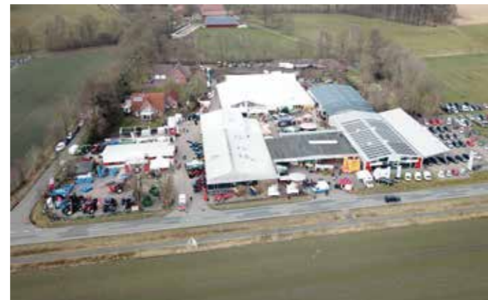
KuK 2018 von oben

Bei diesem reichhaltigen Angebot für jedermann gibt es nur ein Motto und eine Richtung: Es bleibt die Küche kalt, wir machen in Großenvörde Halt. Auf geht's zu Kieken un Köpen 2019!