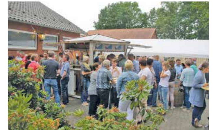
Wein trinken in gemütlicher Atmosphäre

Dorfgemeinschaftshaus ausreichend Platz, damit alle (zumindest von außen) trocken bleiben. Der Erlös des Festes wird dem Großenvörder Freibad – für das sich die Kulturgemeinschaft ja schon seit vielen Jahren einsetzt - zu Gute kommen.