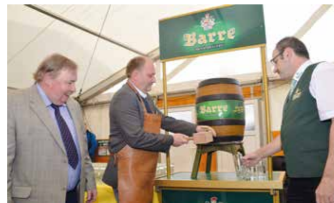
Der traditionelle Fassanstich ist immer ein Highlight