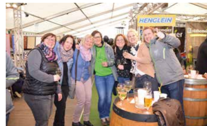
Ein bisschen Spaß muss sein...

Außerdem locken Bäckereien, ein Spargelhof und ein Lebensmittelmarkt mit vielen Leckereien und Köstlichkeiten. Beim Ballonfahrerteam können Sie sich über